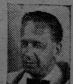
FIGURA DEL MOMENTO

Dag Hammarskjöld, Secretario General de las Naciones Unidas, bajo cuya administración se ha conmemorado en la ciudad de San Francisco, California, el décimo aniversario de la fundación de las Naciones Unidas.