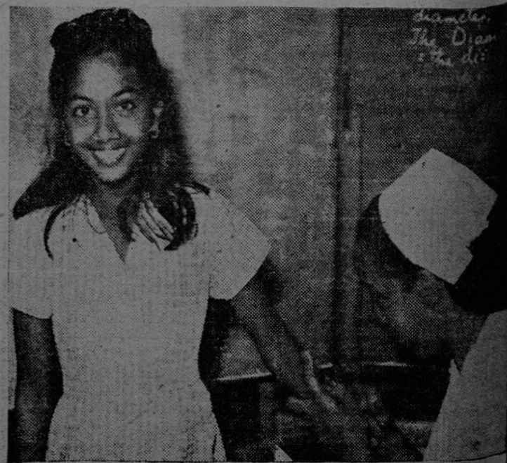
En 1948, la UNICEF unió sus esfuerzos a la Organización Mundial de la Salud para llevar a cabo una campaña en gran escala para atacar el terrible mal de la tuberculosis. Para fines de 1955, se calcula que un millón de niños habrán sido vacunados contra la tuberculosis en el mundo. El grabado nos muestra a una joven de Trinidad en el momento de ser inoculada contra el mal.

En 1953, por ejemplo, veintidós millones de niños fueron salvados de la tuberculosis; tres millones fueron curados del terrible mal de la viruela. El paludismo fué eliminado en muchos lugares de la Tierra. En la América Central solamente, en un año de labor, los casos de paludismo fueron reducidos a la mitad. Se ha reducido el analfabetismo en muchas naciones, etc.