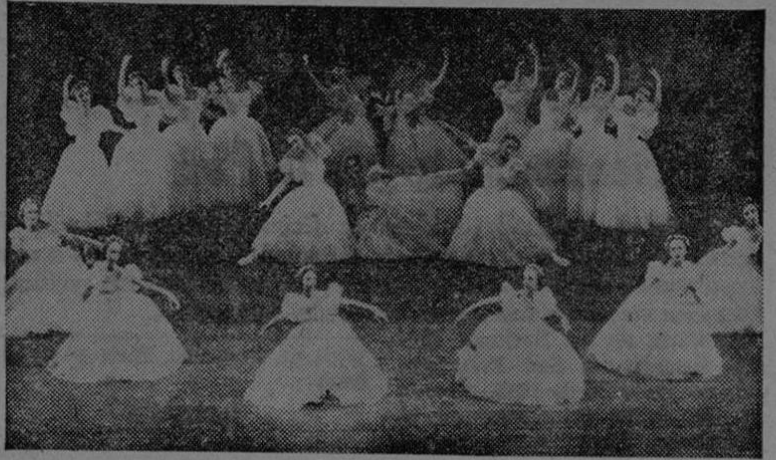
La obra maestra de Michel Fokine, "Sífides" es considerada como una muestra admirable de ballet clásico. Ocupa un lugar de honor en los repertorios de casi todas las compañías de ballet. "Sífides" fué puesta en escena por el Ballet Teatro, de Nueva York, en el escenario del Teatro de Bellas Artes, de México. La foto nos muestra una escena de "Sífides".

CIUDAD DE MEXICO.—Pocas veces se ha observado un entusiasmo tan grande entre los asistentes al Teatro de Bellas Artes como el registrado durante las actuaciones del Ballet Teatro de Nueva York. Con llenos absolutos, la compañía debutó el 29 de junio con "El Lago de los Cisnes", "El Combate", "Pas de Deux", "Cisne Negro" y "Baile de Graduación".