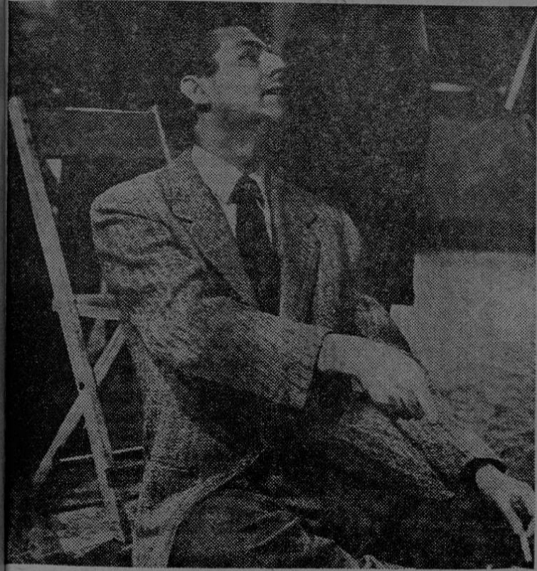
Gian-Carlo Menotti, autor de ocho óperas y ballets, dramas, conciertos para piano y violín, aparece en la foto en un momento de descanso después de un ensayo de su máxima obra "El Santo de la Calle Bleeker", en la ciudad de Nueva York.

Cuando las últimas notas de "El Santo de la Calle Bleeker" se esfuman, el público que asiste a las representaciones de esta obra musical se da cuenta de que ha surgido una nueva modalidad operística.